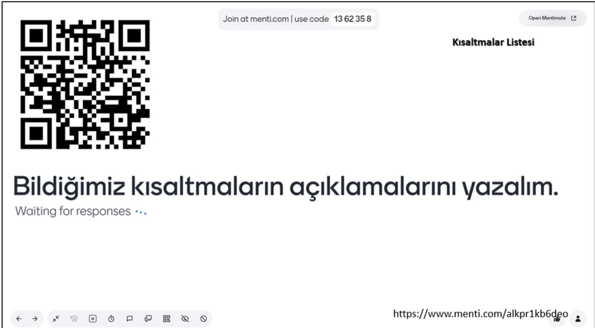
Şekil 6. Mentimeter Uygulaması-2